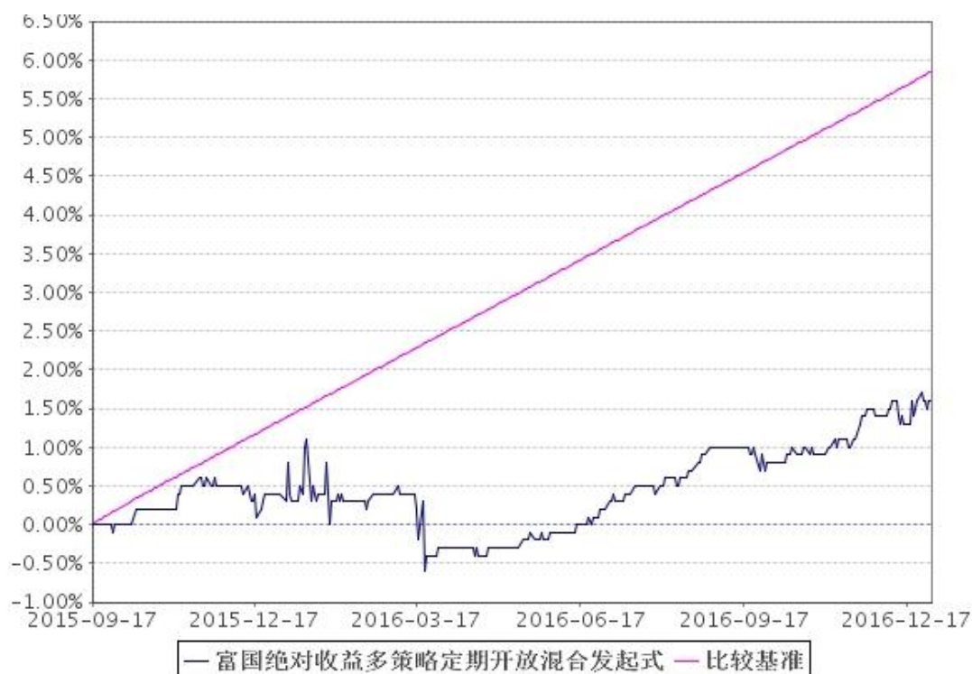
基准收益率变动的比较